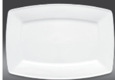
Rectangular dish Ø 280 mm (nr 2760) Ø 320 mm (nr 2758) Ø 380 mm (nr 2762)