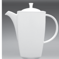
Coffee pot 0,30 l (nr 2763) 1,35 l (nr 2777)