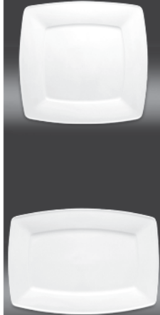
Plate flat square Ø 155 mm (nr 2727) Ø 170 mm (nr 2728) Ø 190 mm (nr 2730) Ø 210 mm (nr 2731) Ø 260 mm (nr 2736) Ø 280 mm (nr 2738) Ø 320 mm (nr 2769)