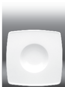
Dessert plate Ø 260 mm (nr 2825)