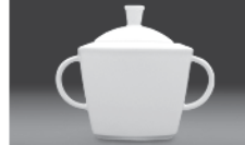
Sugar bowl 0,30 l (nr 2779)