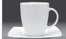
Mug and saucer 0,50 l / Ø 160 mm (nr 2740, 2711)