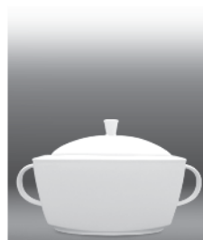
Soup tureen 2,70 l (nr 2764)