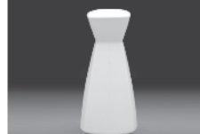
Candlestick 130 mm (nr 2766)