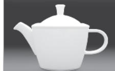
Tea pot 0,40 l (nr 2722) 1,00 l (nr 2721)