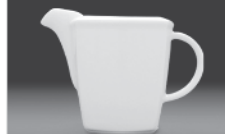
Milk jug 0,15 l (nr 2704) 0,30 l (nr 2705)