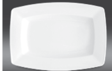
Pickle dish Ø 240 mm (nr 7112)