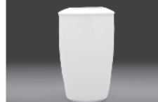
Vase 120 mm (nr 2887) 160 mm (nr 2898)