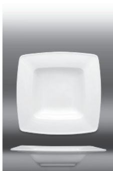
Plate deep Ø 215 mm (nr 2719) Ø 230 mm (nr 2720)