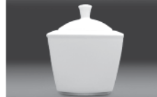
Sugar bowl 0,30 l (nr 2789)